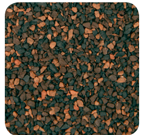
Café Cosecha CC012A