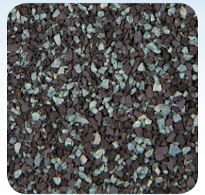
Gris Peltre CC010A