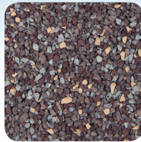
Madera Curada CC004