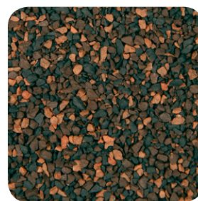
Harvest Brown CC012A