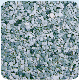
Tono de Plata CC045A