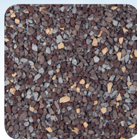
Weathered Wood CC004