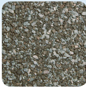
Pizarra Antigua CC003A