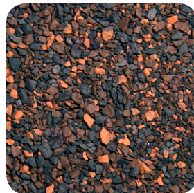
Nogal Americano CC047