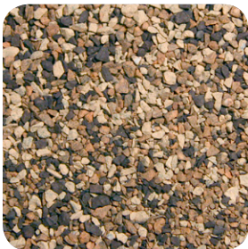
Tono de Madera CC046