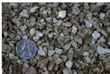
Aislante de vermiculita típica

Observe las fotos de este sitio Web y luego observe el material de aislamiento sin tocarlo. El aislante de vermiculita es como piedrecillas, es un producto que se vierte y usualmente es de color gris-café o plata-dorado.