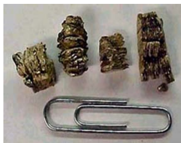
Tamaño de las partículas de vermiculita comparado con un clip de papel clip