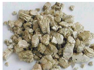
Aislante de vermiculita típica