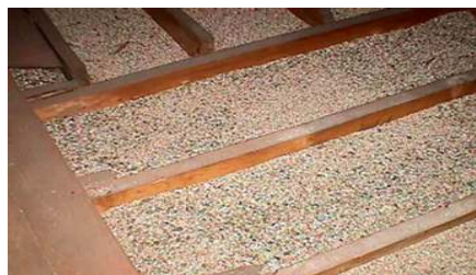
Aislante de vermiculita entre vigas en el ático